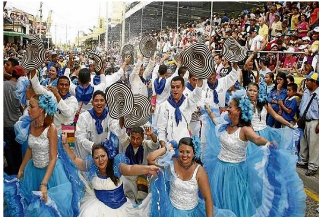
Figura 6. Actividades culturales

Durante las festividades se llevan a cabo los reinados popular y Nacional del 20 de enero, así mismo, se realiza el Encuentro Nacional de Bandas en el mes de agosto, las Fiestas de San Pedro y San Pablo en junio y el Festival Sabanero