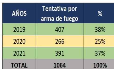
Datos estadísticos sobre Tentativa por arma de fuego durante los últimos 3 años.

Fuente: SGP, Sistema Integral Informático de la Policía Nacional del Ecuador SIIPNE 3W